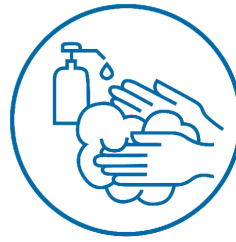
VOLDOENDE HANDEN WASSEN MET ZEEP

Alle lokalen hebben een vuilnisemmer met deksel. De kinderen brengen zakdoekjes en reinigingsdoekjes mee naar school.