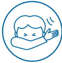
HOESTEN OF NIEZEN IN DE ELLEBOOG

Alle lokalen worden permanent verlucht. Alle werkoppervlakten worden regelmatig gereinigd. Alle toiletten worden dagelijks gepoetst.