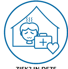
ZIEK? IN DEZE RUIMTE KAN JE JE AFZONDEREN

Alle lokalen hebben een wasbakje, zeppompje en doekjes om de handen te drogen. Op beide speelplaatsen werden wasgotten aangebracht. Reinigen van de handen voor en na het betreden van de turnzaal.